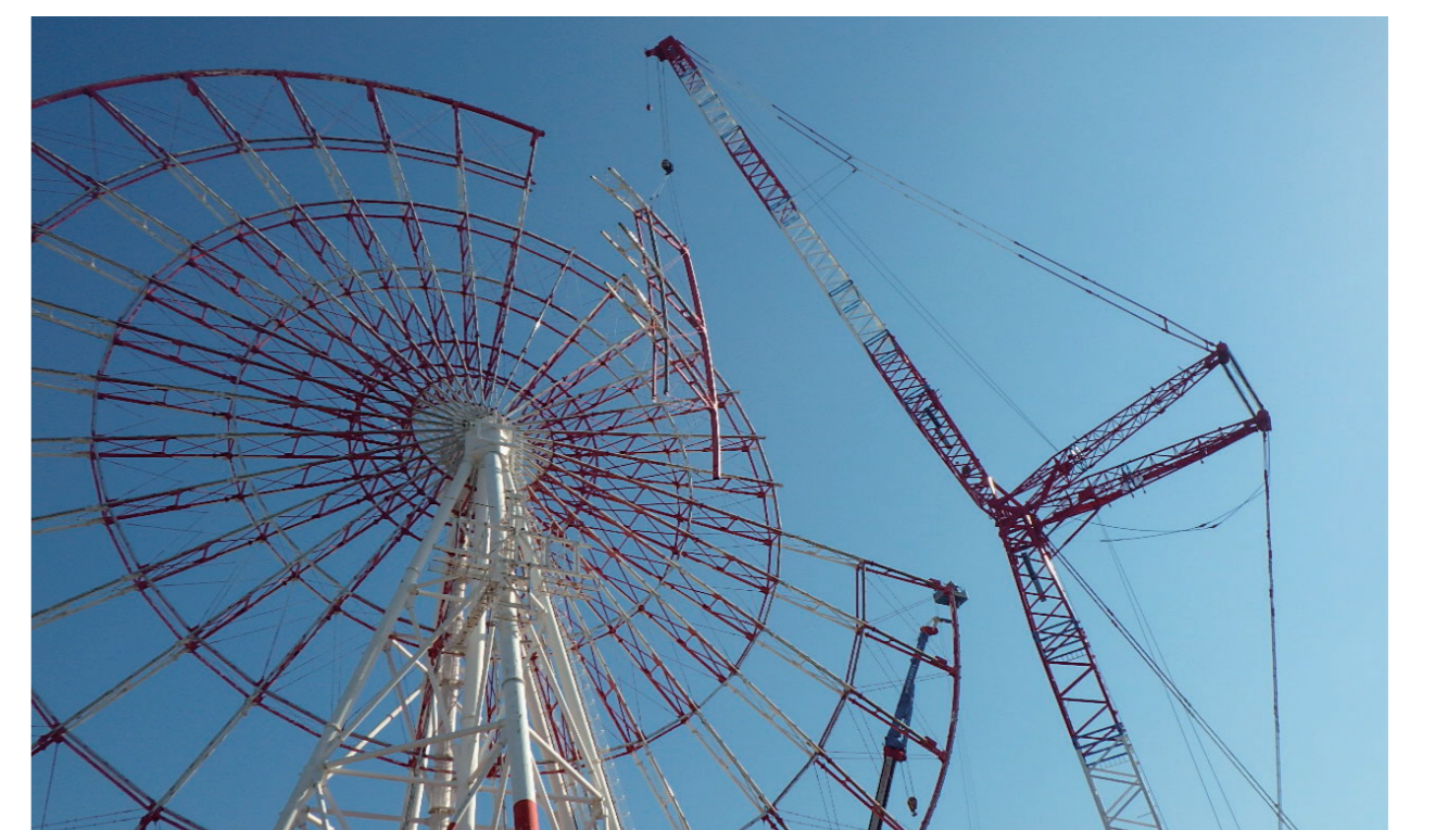
パレットタウン大観覧車解体撤去工事写真