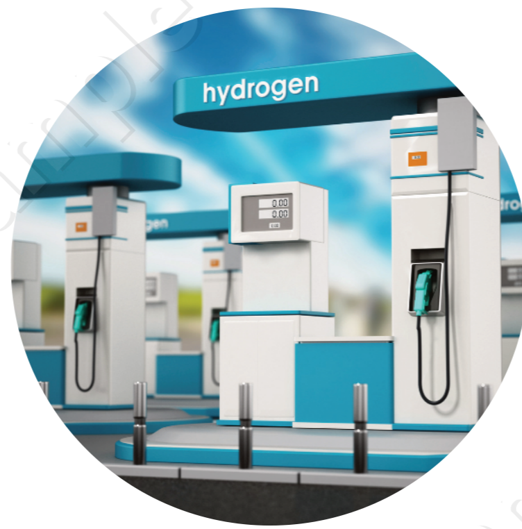
水素ステーション