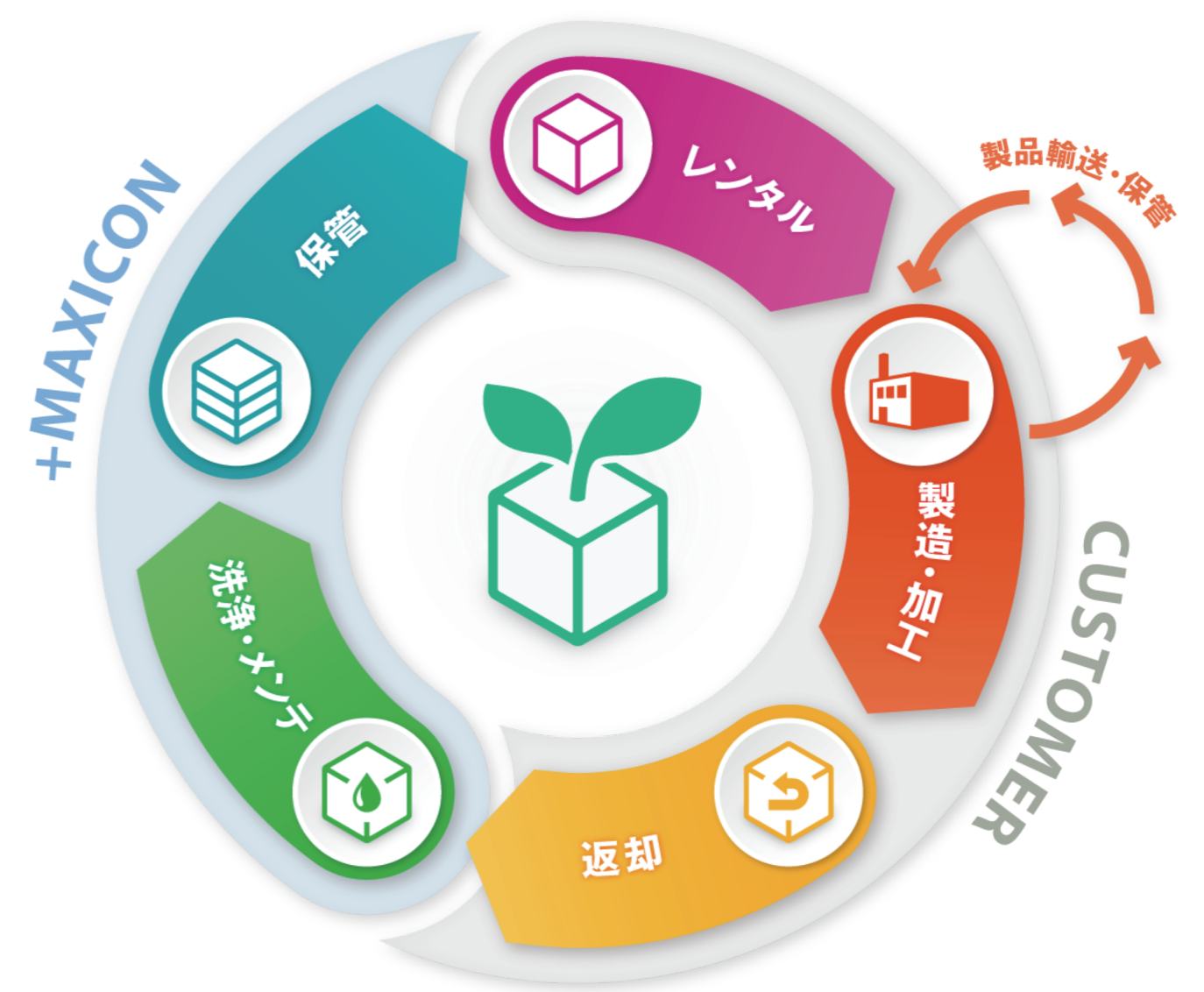
MAXICONのレンタル容器[循環型]