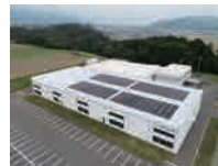
駒ヶ根工場の太陽光発電及び売電 (再生可能エネルギー)