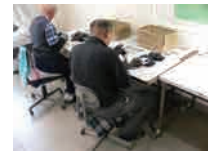
社員教育の充実 (社内資格 プリンターエキスパート)