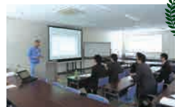
社員教育の充実 (社内資格 プリンターエキスパート)